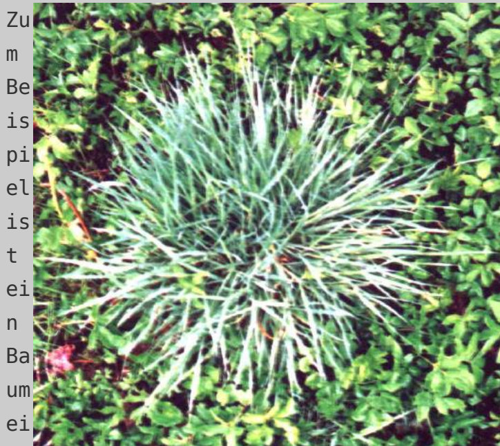
n Ein System eingebettet in ein anderes System.

Was als „System“ bezeichnet wird, hängt bei solchen Betrachtungen von der Willkür des Betrachters ab. Spricht jemand von einem „ganzen System“, kann nur ein (willkürlich herausgelöster) Teilaspekt eines größeren Zusammenhangs gemeint sein.