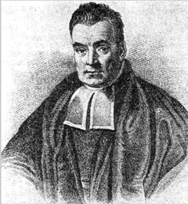
Thomas Bayes