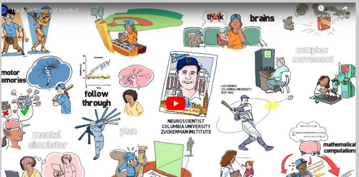
The Brain science of baseball (Columbia Univ., D. Wolpert 2019)

Diese Erkenntnis verstörte viele Biologen und Hirnforscher, die Bewegungsroboter konstruieren wollten. Denn offenbar sind Nerven- und Bewegungszellen nur Teile lebender Schwingungskreise, die für sich allein nicht sinnvoll funktionieren können.