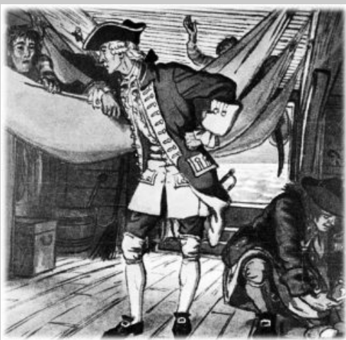
James Lind 1747

Die erste systematisch-eingesetzte, spezifisch-wirksame Behandlung (Sauerkraut-Diät gegen Skorbut) wurde von einem Kapitän eingeführt: James Cook 1776. Dass Zitronensaft Skorbut heilen konnte, war bereits in einem kontrollierten Experiment von einem Schiffsarzt (James Lind 1747) nachgewiesen und auch publiziert worden, wurde aber von der damaligen universitären Lehr-Medizin als Unsinn abgelehnt (Die Geschichte der Skorbut-Heilung).