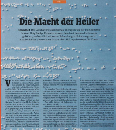
Spiegel Nr. 34, 18.08.2018 Medizin oder Mumpitz? SZ 17.08.2018

Se it Ja hr en sc hr ei be n Jo ur na li st : i nn en , Ho mö op at hi e se i ge fä hr li ch . Si