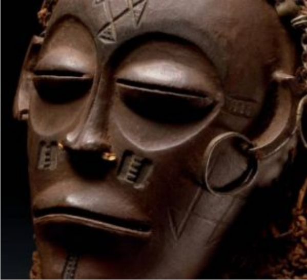
Magische Symbole. Bakongo Maske, Jäger 1989