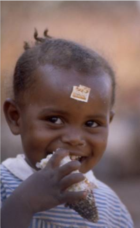
Emotionale Wachheit. Bild: Jäger, Tansania 1983