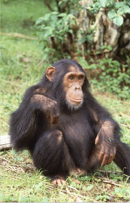
Neugier (Bild: Jäger, Gombe, Tansania 1985)

Da nn en tw ic ke lt si ch au s An gs t Lä hm un g. Od er au s Tr au er De pr es si on , au s Ek el Ma ge rs uc ht ,