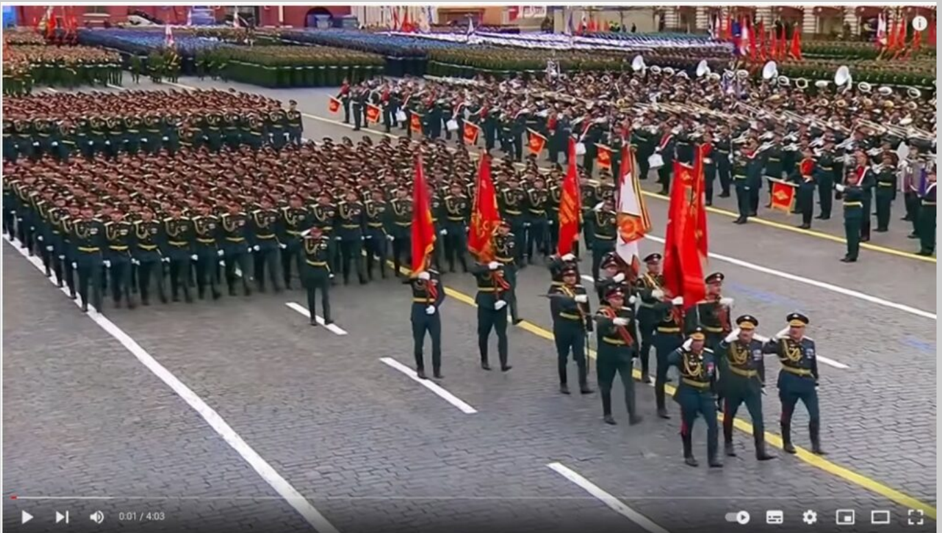
Yael Deckelbaum - What About the Women (Official Video)