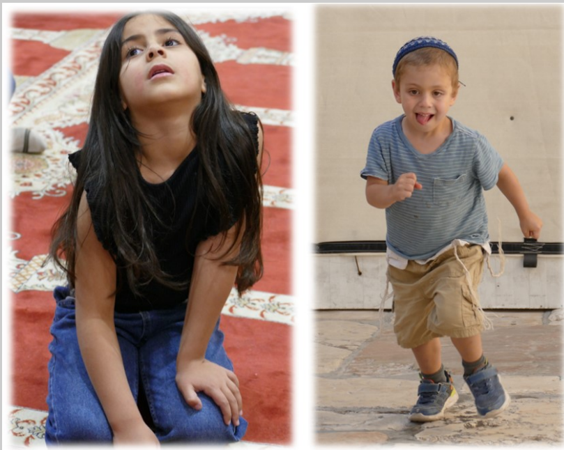
GeUnbekümmerte Kinder in Hebron und Jerusalem.

fü hl e si nd Te il sä ug er ti er - sp ez if is ch er Ko mm un ik at io ns fo