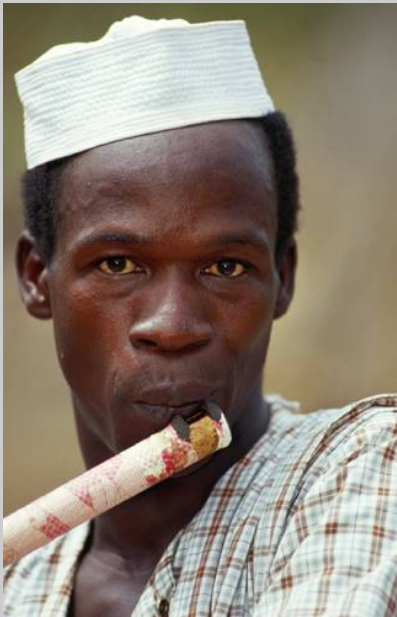
Frau in Senegal (Cordula Kropke 2001)

Me ns ch en en ts te he n au s zw ei Ke im ze ll en . Au s de r Ei ze ll e de r Mu tt er un d de m