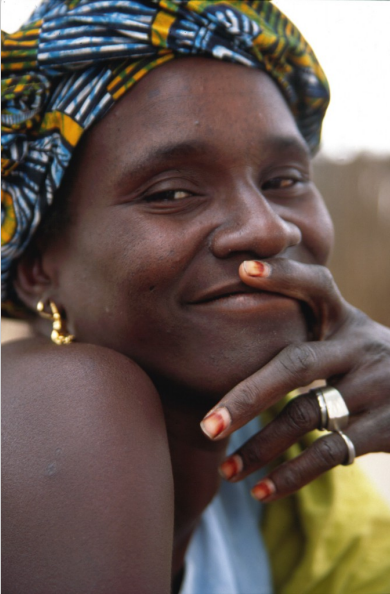
Frau in Senegal (Cordula Kropke 2001)

Die e Ve rä nd er un g de r ge ne ti sc he n Vo rg ab en in de r Ge bä rm ut te r (E pi ge ne ti k) wi rd du rc h de