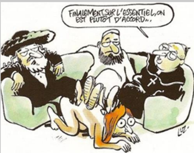
„Immerhin über das Wesentliche sind wir uns einig ...“ Karikatur: Luz ch (Rénald Luzier), Charlie Hebdo

Na ch ih re r Th es e „d er mä nn li ch en Kr ie ge r“ se ie