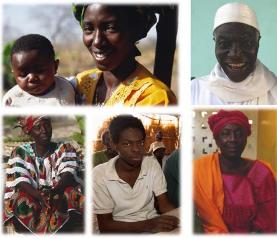
Junger Mann (Held, Liebhaber, Krieger). Junge Frau (fordernde Schönheit). Junge Mutter und Kind. Alter Macho. Starke Großmutter.

An de re Vo r- Me ns ch en , wi e di e Ne an de rt al er , wa re n un se re n di re kt en Vo rf ah re n kö rp er li