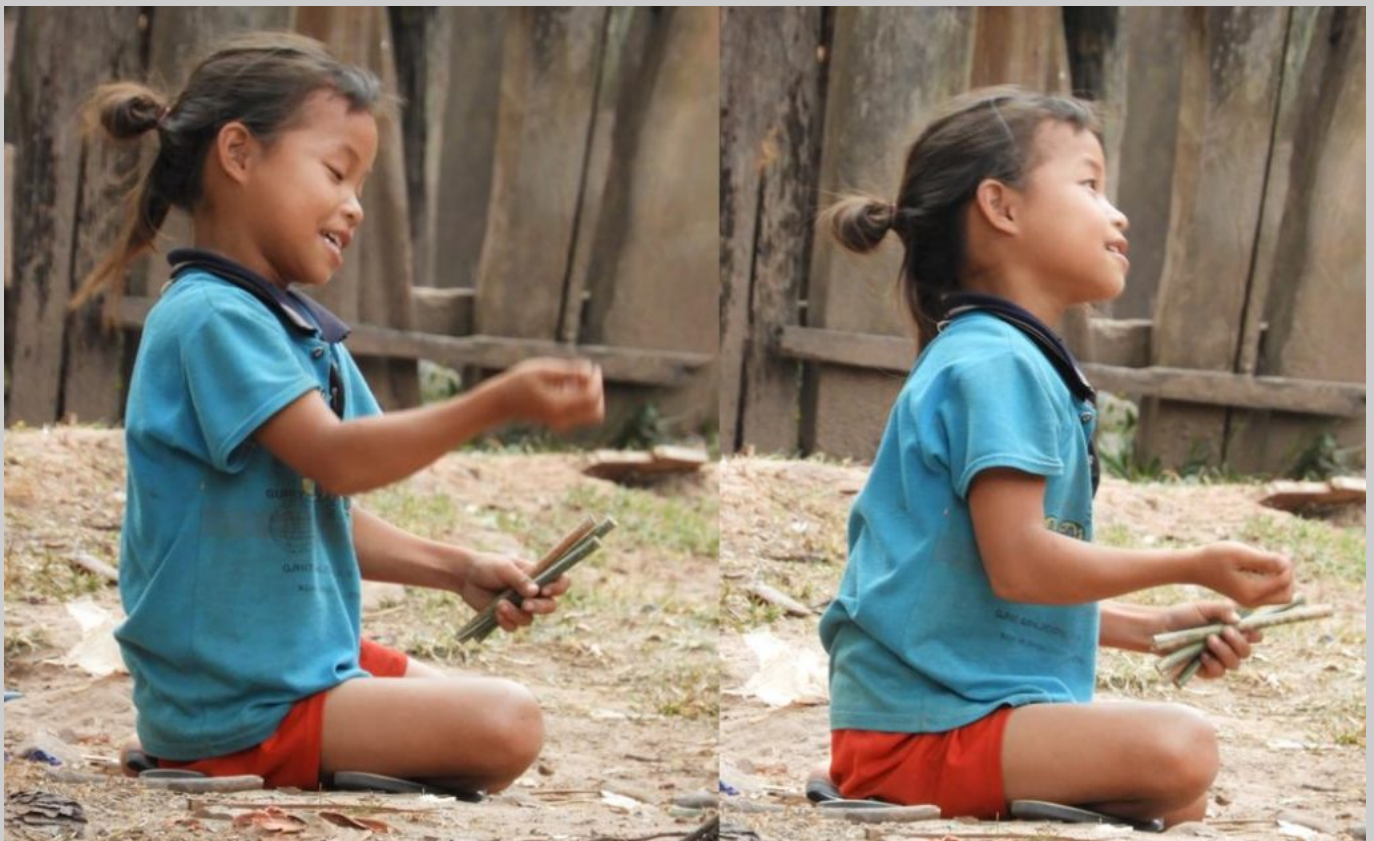
Die Geste des Lebens: Absichtslos tun. Bild: Jäger Laos 2018 Die Geste des Machens (nach Flusser)

Die Geste lädt einen Prozess mit Bedeutung auf. Nach einem Schmerz folgt eine Reflexantwort, die dann zu einer bedeutsamen Geste (z.B. der Abwehr) erweitert wird. Der Schmerz ist real und unmittelbar, die absichtsvolle Geste aber bedeutungsgeschwängert und kann übertrieben werden.