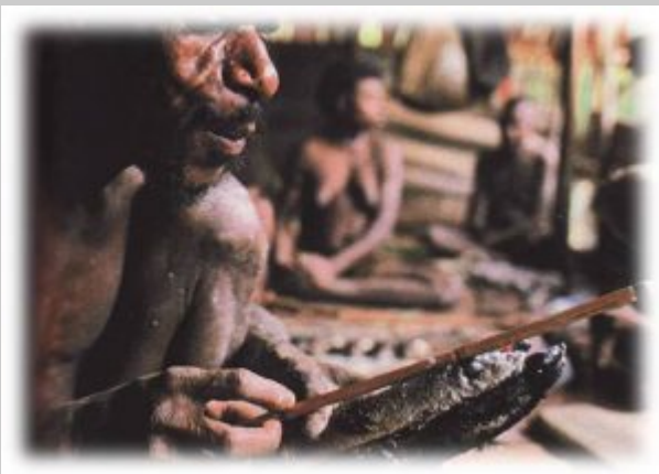
Gewandtheit: Handarbeit im Flow

Wenn sich die Hände mit einer Nadel oder mit einem Blindenstock verbinden „fühlt“ nicht etwa die Kontaktstelle der Haut-Nadel-oder-Stock-Verbindung, sondern der ganze Körper: Alle Signale und Schwingungen, die in das in das Kleinhirn eingehen, und deren inneren Auswirkungen werden dann zu einem sinnvollen Bild „hochgerechnet“. (Schahmann 2019) Die Hand wirkt deshalb erst dann einzigartig gelassen, wenn sie über die hoch-bewegliche und