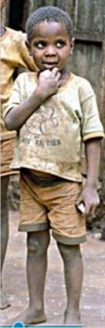
Verlegenheit, Bild: Jäger Tansania 1983