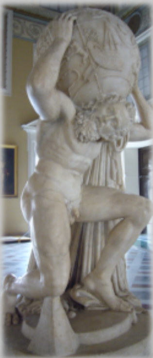
Atlas, der letzte Titan, nach dem verlorenen Krieg gegen die Olympier. Nationalmuseum Neapel

In ih re n Si pp en üb er na hm en un te rs ch ie dl ic he