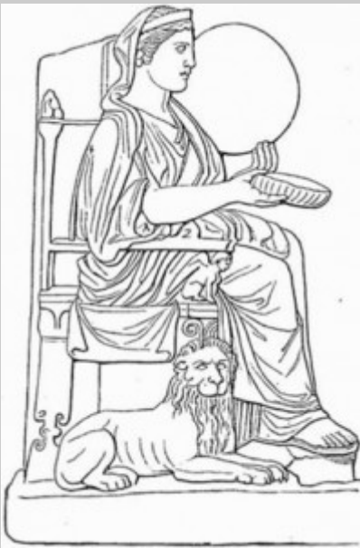
Rhea, die Titanen-Tochter der Erdgöttin Gaia, Gattin des Titanen Cronos (der Zeit).

Zw is ch en de r An ku nf t „n eu er Af ri ka ne r“ un d de m En de de r Ne an de rt al er sc he in t ei n