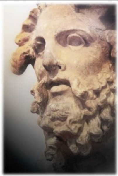
Kopf eines Titanen. Nat. Arch. Mus. Athens.

Vo r 40 .0 00 Ja hr en ga b es in Eu ro pa un d As ie n ke in en Ta ba k. Da s Ni