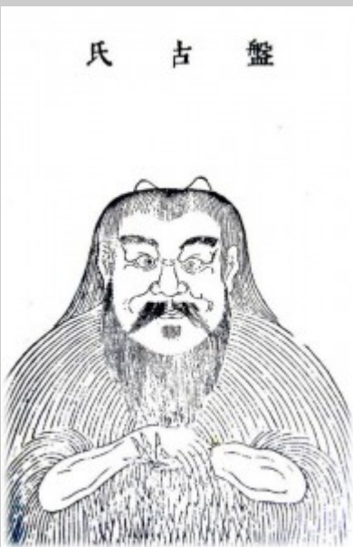
Der Riese Pangu: „Das erste Lebewesen auf der Erde.“ Chinesische Mythologie.

Ge ne ko mm en ab er ni ch t nu r in de n Ze ll - Ke rn en , so nd er n au ch