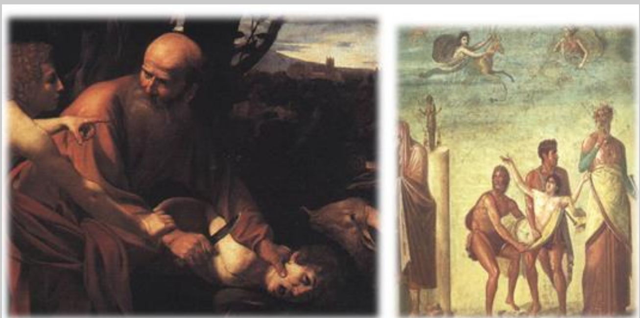
Befehle in der Trance-Logik sind absolut. Fühlen und Denken spielen keine