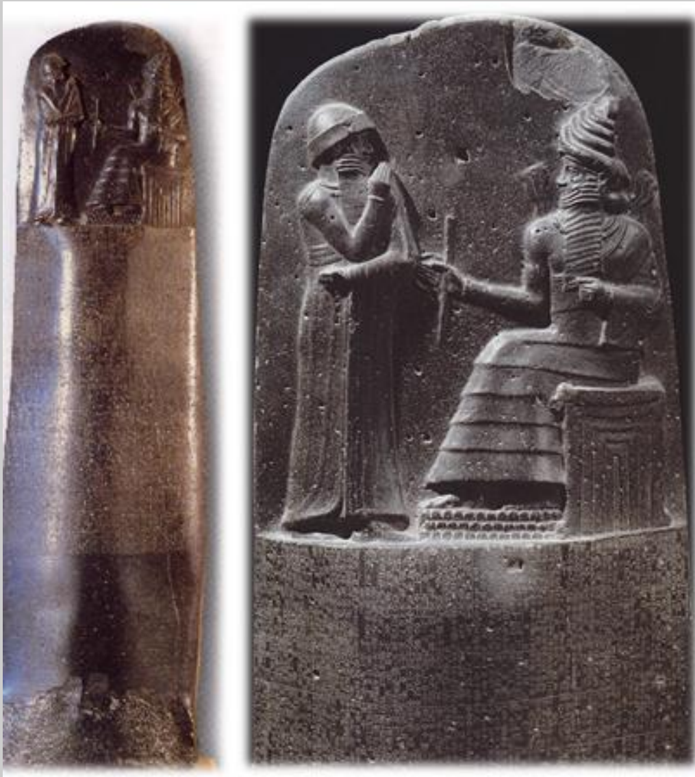
Der König ist besessen. Er lauscht der inneren Stimme („Gott“), der ihm Gesetze diktiert. Stele des Hamurapi ~1700 v.u.Z.