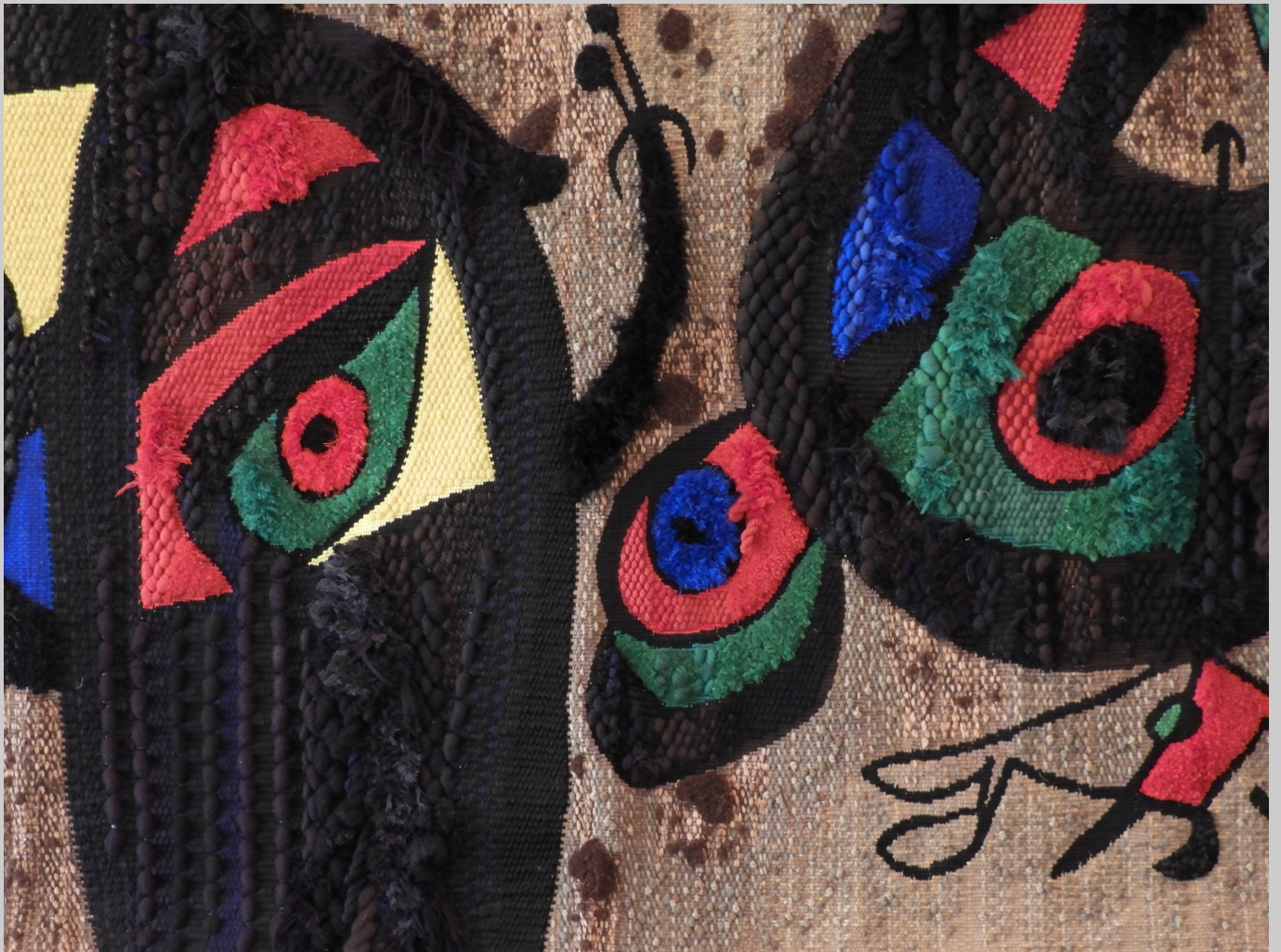
Kunst in archaischer Trance: „Wenn ich arbeite, werfe ich mich ins Leere. In etwas das stärker ist als ich.“ Joan Miró, Palma de Mallorca.