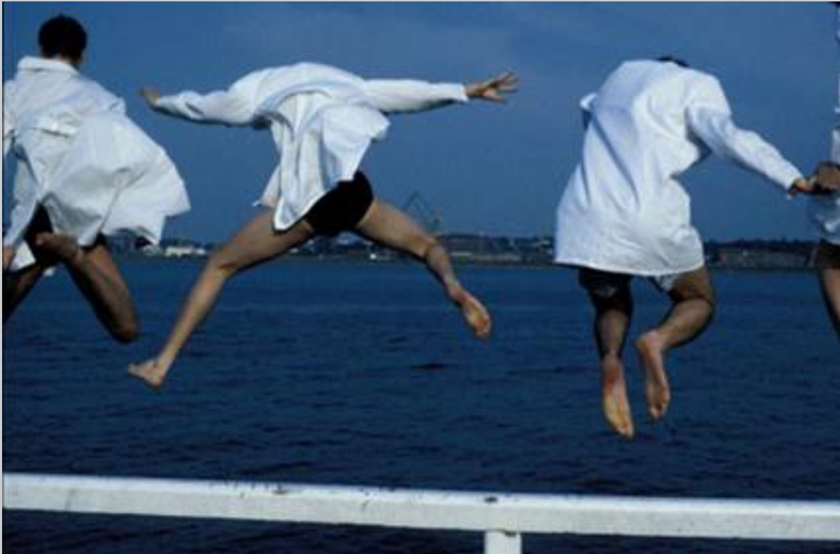
Spaß haben und im Prozess fließen (Trance light oder Flow), Bild Jan Falkenberg.