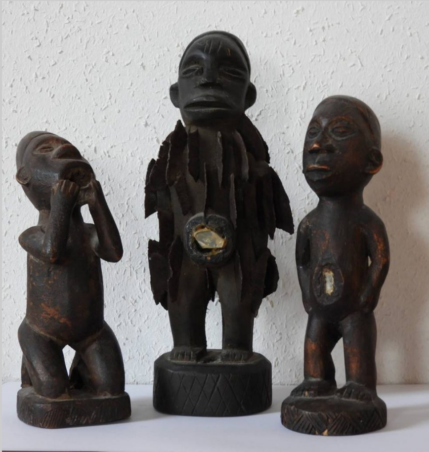
Trance-Fetisch aus Westafrika zur Abwehr böser Geister. Bild Jäger 2019